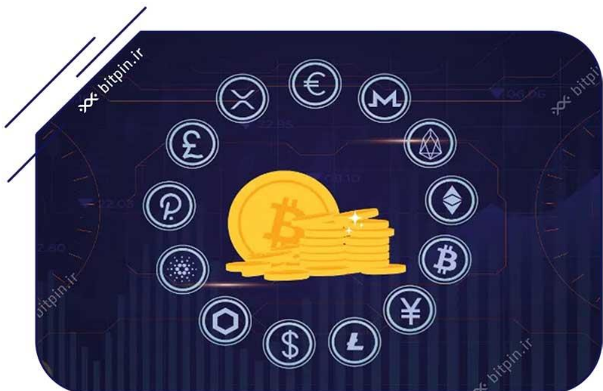
آلت‌کوین‌ها با الگویی شبیه به بیت‌کوین ساخته شده‌اند.

این تفاوت‌ها باعث جلب دیدگاه سرمایه‌گذاران شده است که آلت‌کوین را جایگزینی برای بیت‌کوین می‌دانند. سرمایه‌گذاران انتظار دارند سود بیشتری کسب کنند، چراکه آلت‌کوین‌ها با جذب بیشتر کاربران، افزایش قیمت خواهند داشت.