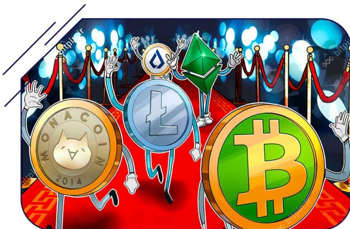
آلت‌کوین‌ها پس از بیت‌کوین ساخته شدند.

آلت کوین ارز دیجیتال غیر از بیت کوین است. آنها ویژگی‌های مشترکی با بیت‌کوین دارند اما از جهات دیگر متفاوت هستند. به‌عنوان مثال، برخی از آلت‌کوین‌ها از سازوکار اجماع متفاوتی برای تولید بلاک یا اعتبارسنجی معاملات استفاده می‌کنند.